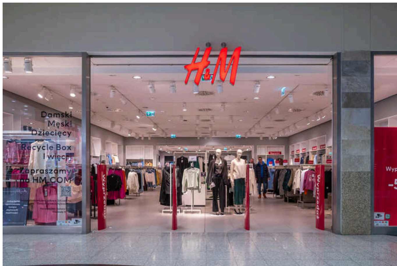
Н&amp;М почав процес ліквідації компанії у РФ, - росЗМІ

Основна юрисобда шведського ритейлера Н&М у Росії - ТОВ "Ейч енд Ем" - запустило процес ліквідації компанії.