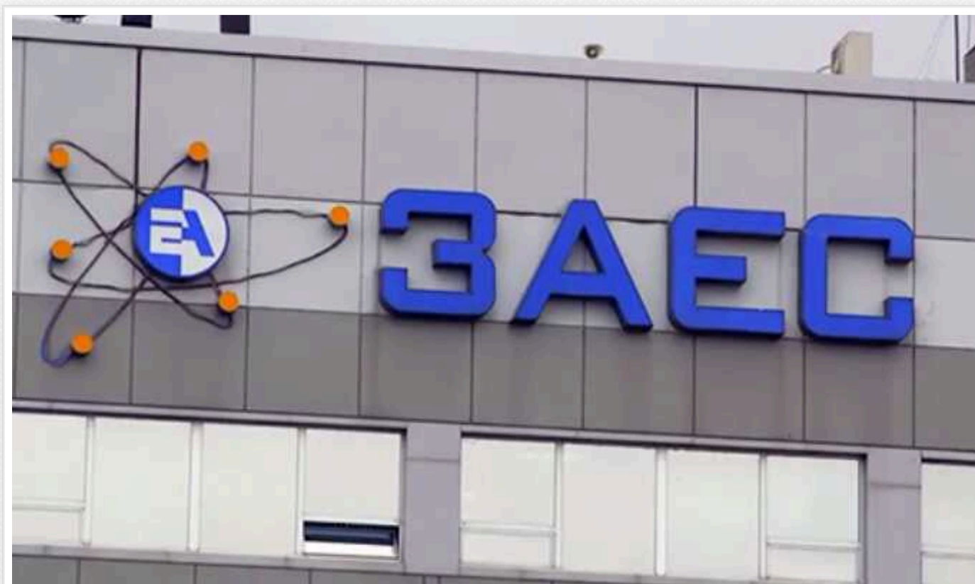
"Ситуація тільки погіршується": міністр енергетики розповів, скільки часу піде на відновлення ЗАЕС після деокупації

Після того, як Запорізька атомна електростанція в Енергодарі повернеться під контроль України, треба буде проробити багато роботи. Для перезапуску всіх шести енергоблоків знадобляться роки.