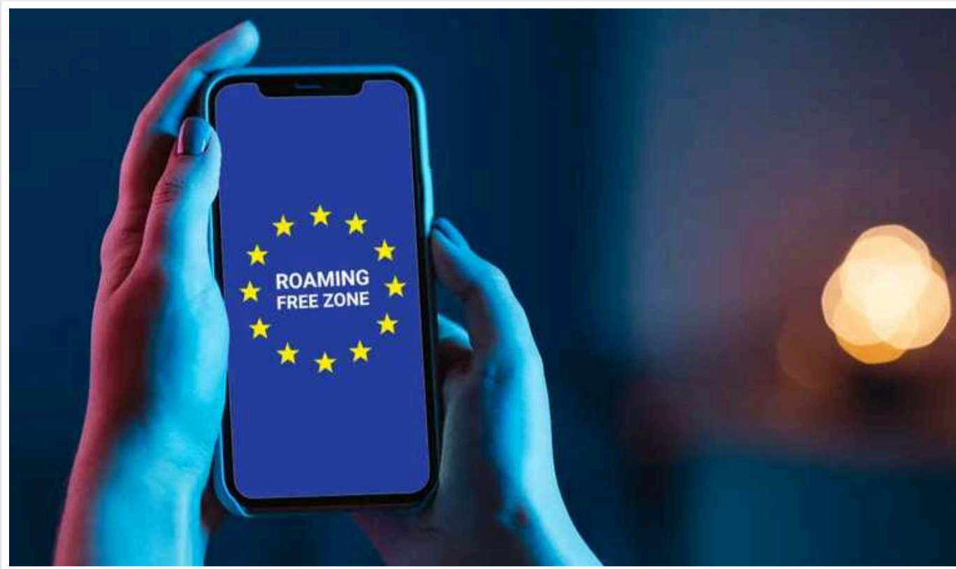
Президент Зеленський підписав закон про єдину роумінгову зону з Євросоюзом

Президент України Володимир Зеленський підписав закон про єдину роумінгову зону з ЄС.