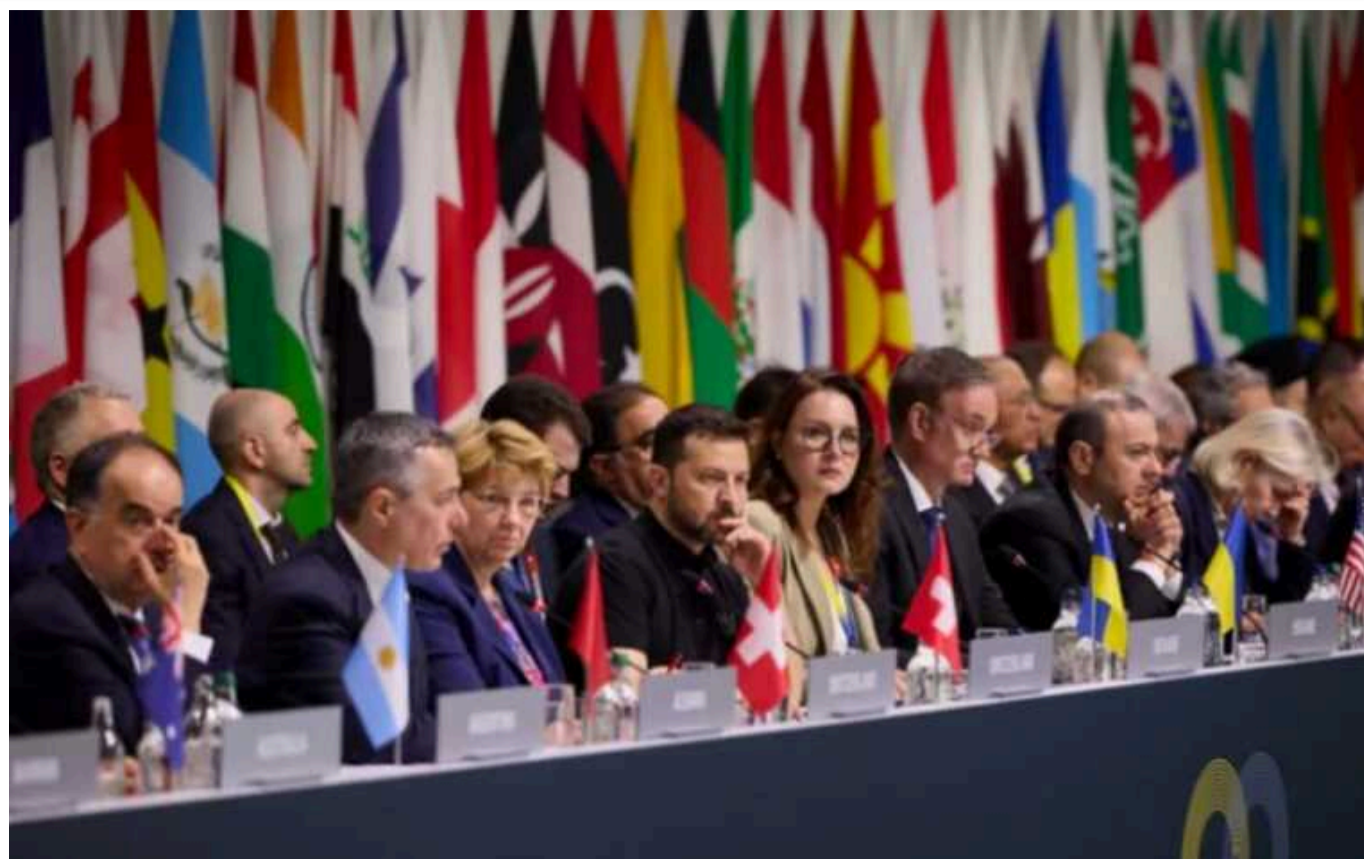
У Швейцарії оцінили результати Саміту миру по Україні