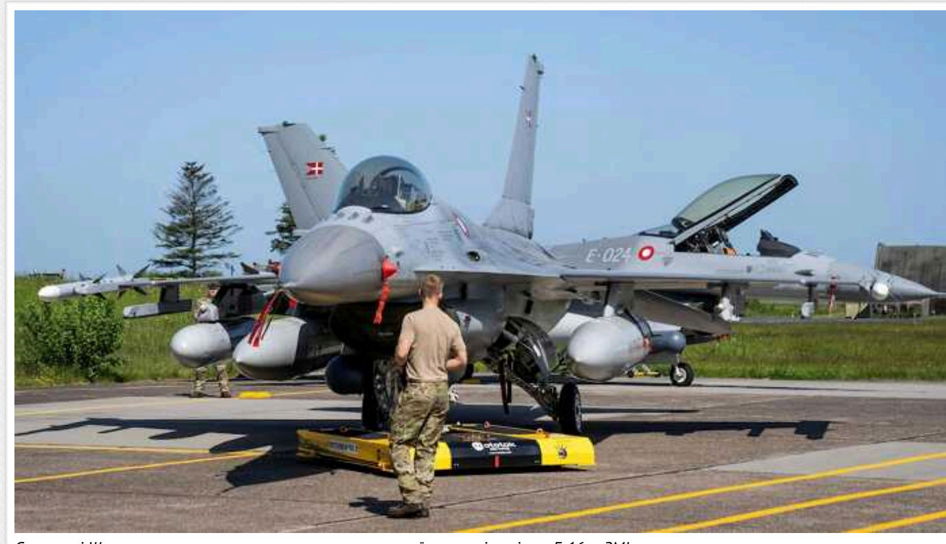
Сполучені Штати «навмисно затягують» навчання українських пілотів на F-16, – ЗМІ

Про це заявила The Times голова комісії з озброєнь та безпеки Верховної Ради Олександра Устинова.