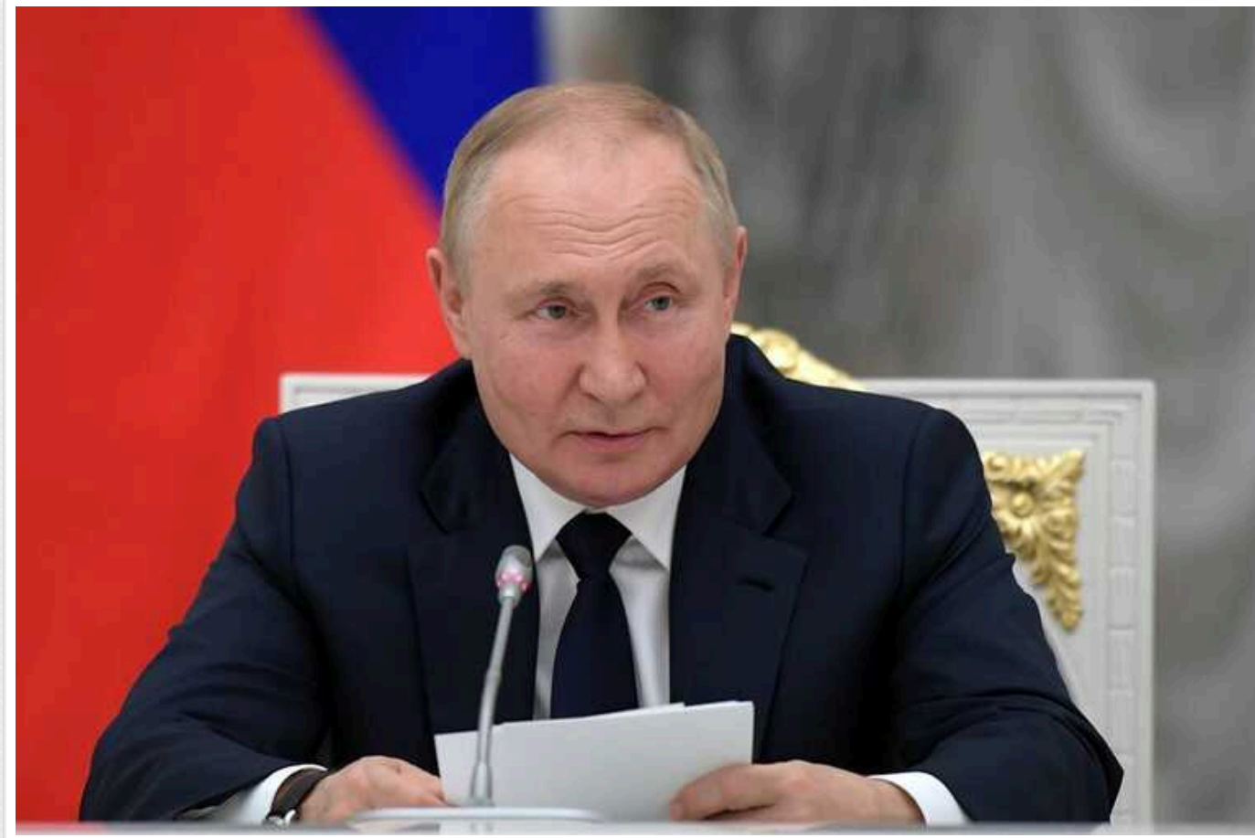
Перед візитом до КНДР Путін написав статтю: поскаржився на США і згадав Україну

Напередодні візиту в КНДР пропагандистська північнокорейська газета "Нодон синмун" опублікувала статтю диктатора Володимира Путіна, де він скаржився на Сполучені Штати. Також головний воєнний злочинець РФ подякував КНДР за підтримку Росії у війні проти України.