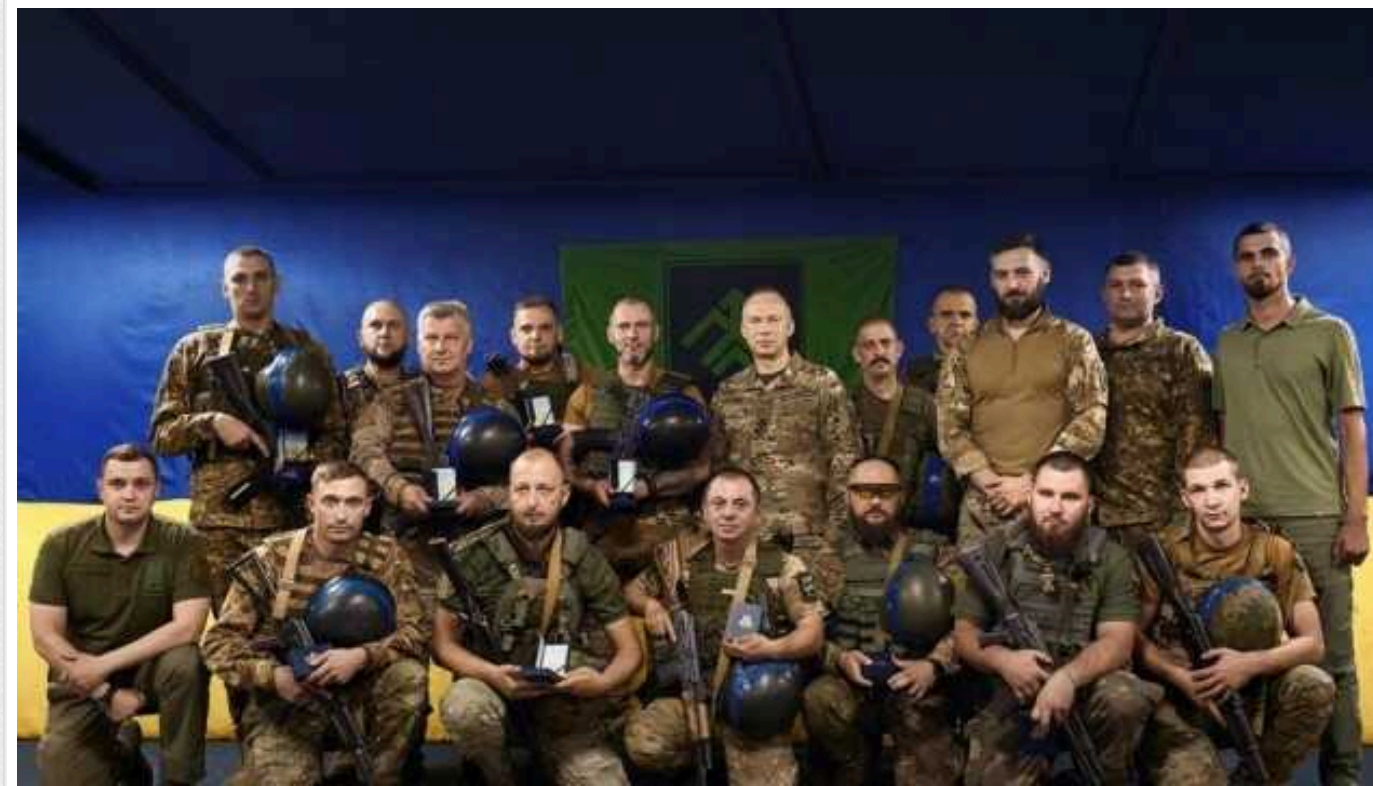
Військова бригада Нацгвардії «Хартія» отримала нагороди за оборону Вовчанська

Головнокомандувач Збройних сил України Олександр Сирський відзначив нагрудними знаками "Золотий хрест" військовослужбовців бригади Нацгвардії України "Хартія" за оборону Вовчанська.