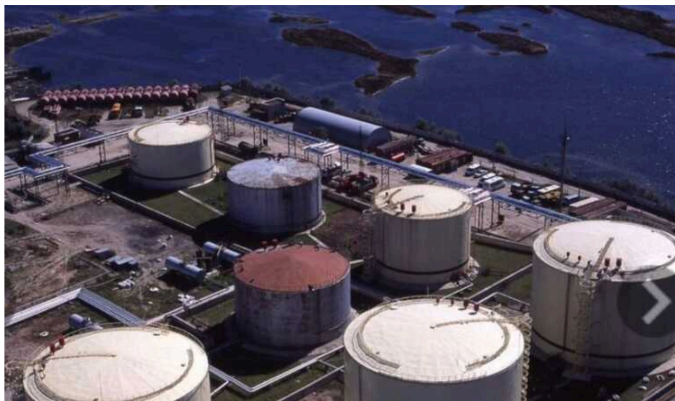
У Краснодарському краї РФ була атакована ще одна нафтобаза

У районі опівночі 18 червня мешканці Темрюкського району повідомляли у місцевих чатах про вибухи. Однак офіційної інформації від влади або Міноборони Росії наразі не було.