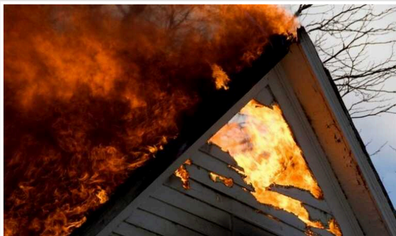
На Львівщині під час пожежі у приватному будинку загинуло подружжя

У ніч на вівторок, 18 червня, у Червоноградському районі Львівщини у приватному будинку виникла пожежа, під час якої загинуло літнє подружжя, ще одного чоловіка з опіками шпиталізували.