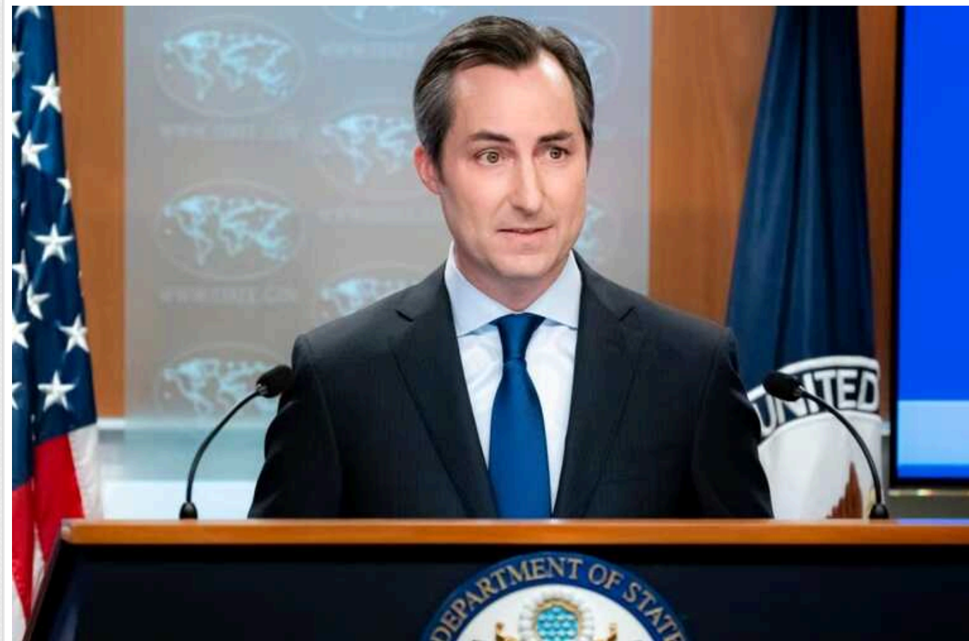
Вимоги Путіна до України суперечать Статуту ООН, моралі та здоровому глузду, – Держдеп США

У Державному департаменті Сполучених Штатів розкритикували так званий "мирний план" лідера РФ Володимира Путіна, відзначивши неготовність РФ до серйозних дискусій щодо миру в Україні.