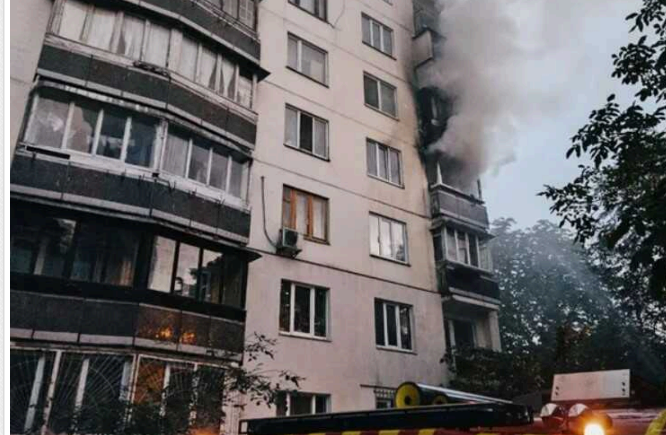
У столиці сталася пожежа в багатоповерхівці: евакуйовано 10 осіб

У Солом'янському районі Києва у вівторок, 18 червня, сталася пожежа в багатоповерхівці. Під час гасіння вогню білці ДСНС евакуйовали з будинку 10 осіб.