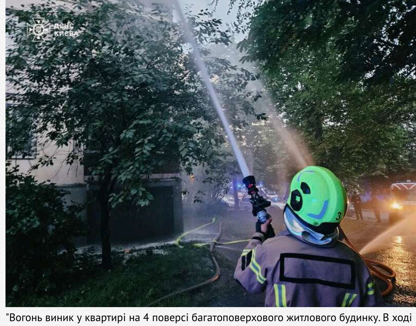
"Вогонь виник у квартирі на 4 поверсі багатоповерхового житлового будинку. В ході ліквідації, на свіже повітря було виведено 10 осіб. Загоряння ліквідовано о 04:58. На щастя, ніхто не постраждав", – уточнили в ДСНС.