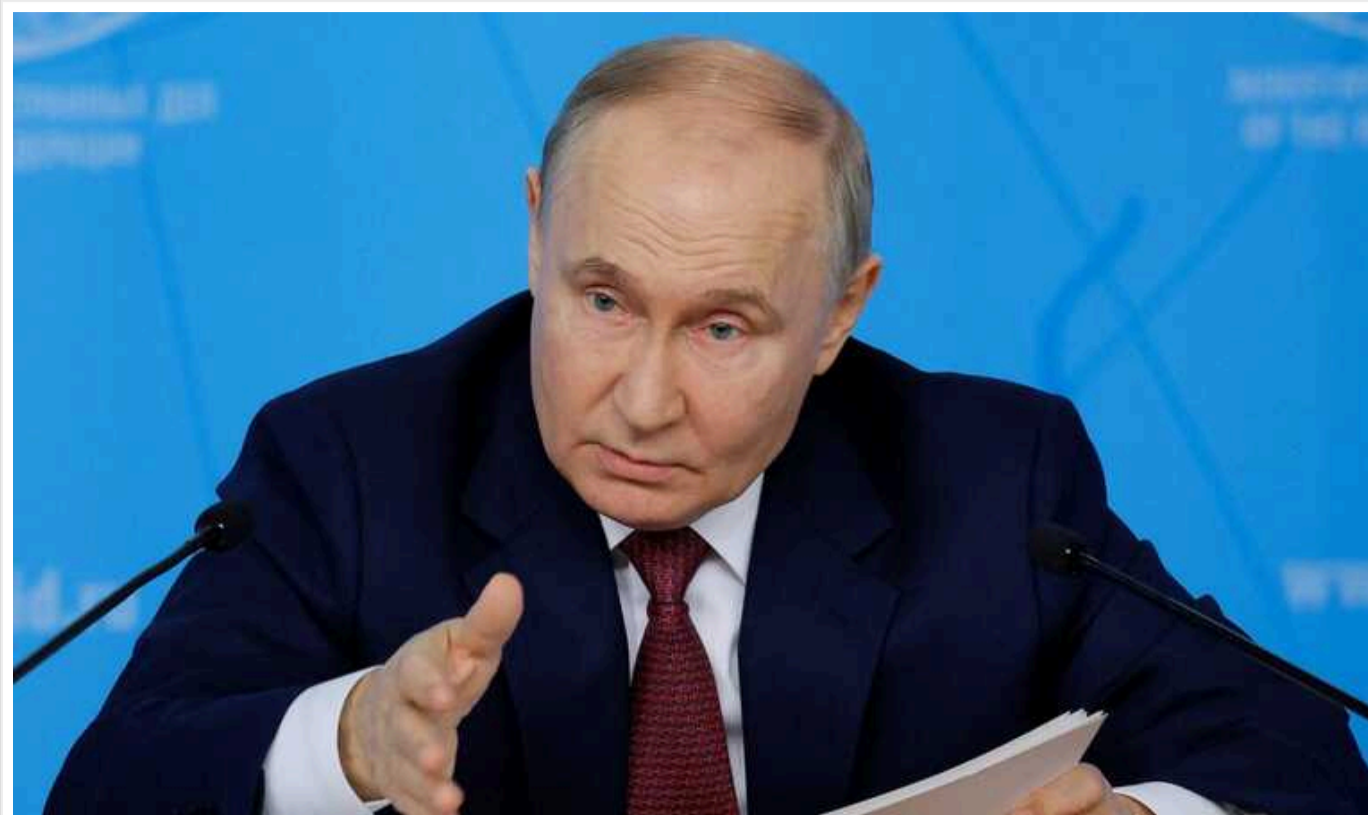
Путін готує наступників режиму – призначає родичів і дітей чиновників, – ISW

Російський лідер Володимир Путін намагається підготувати ймовірних наступників свого режиму з-поміж родичів та дітей чиновників.