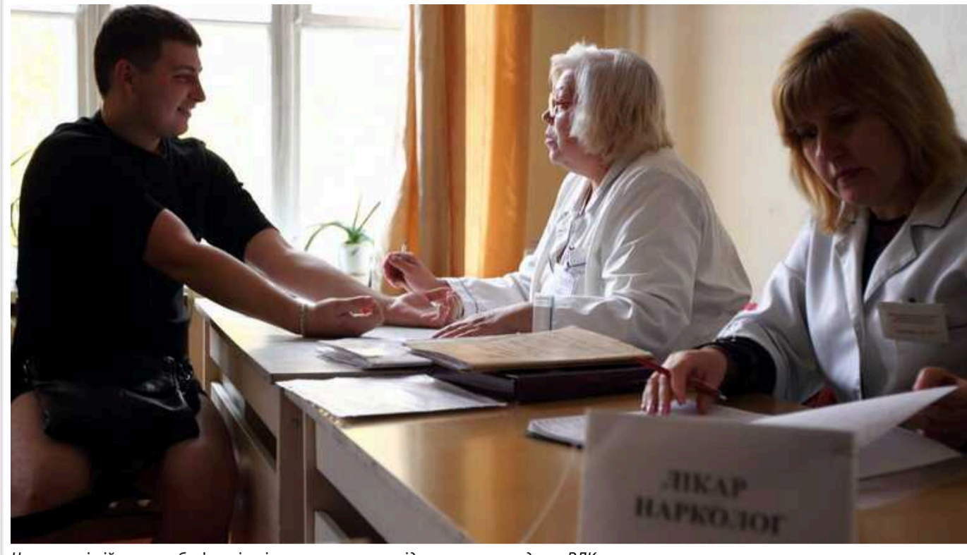
Чи повинні військовозобов'язані, які мають право на відстрочку, проходити ВЛК

В Україні віднедавна діє нове законодавство щодо мобілізації, яке передбачає зміни в правилах призову до війська для військовозобов'язаних, призовників та резервістів. Раніше для отримання відстрочки документи подавали як до проходження військово-лікарської комісії (ВЛК), так і після цього.