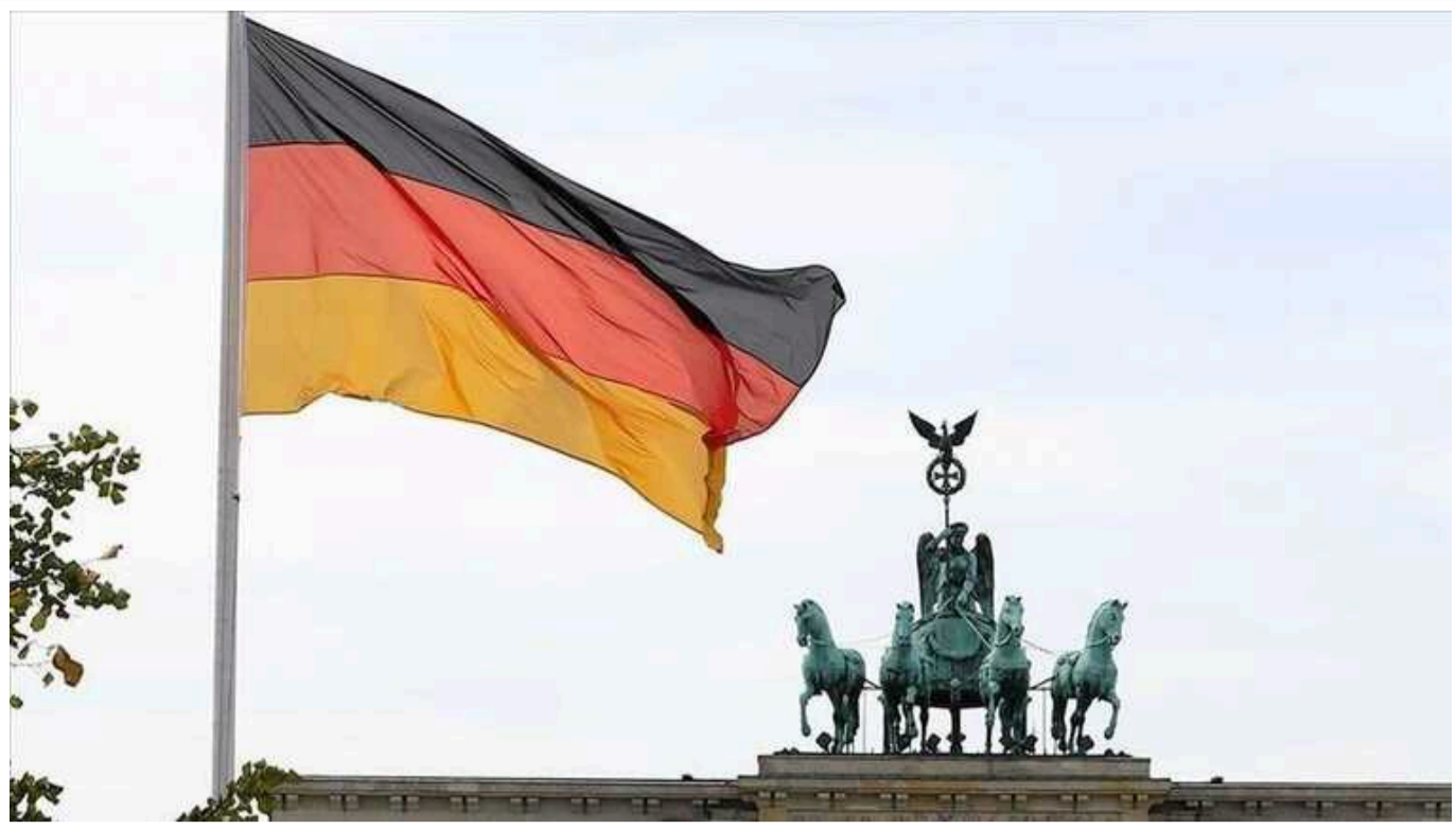
FT: Найбільша профспілка Німеччини готується до боротьби за зарплати

Найбільша промислова профспілка Німеччини готується до битви за оплату праці в промисловому центрі країни після того, як вона закликала до 7-відсоткового підвищення заробітної плати мільйонам працівників електротехнічної та металургійної галузей.