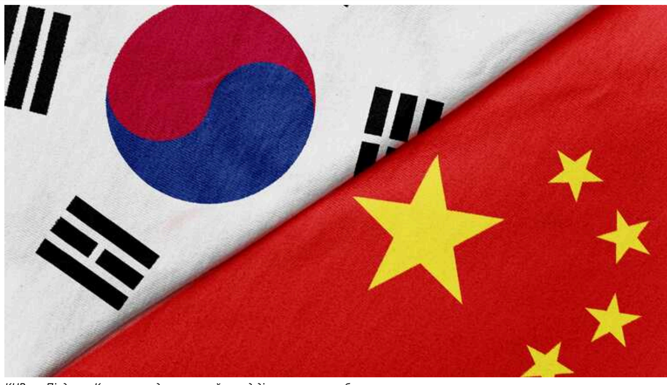
КНР та Південна Корея проведуть перший раунд діалогу з питань безпеки

Південна Корея і Китай у вівторок, 18 червня, проведуть перший раунд дипломатичного і безпекового діалогу у форматі «два плюс два» за участю заступників міністрів закордонних справ і представників оборонних відомств.