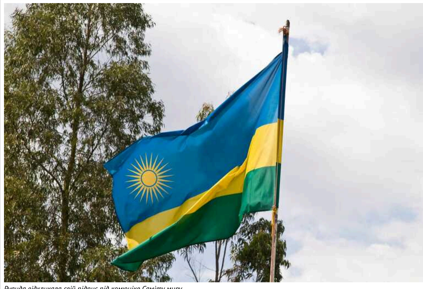
Руанда відклікала свій підпис під комюніке Саміту миру

Руанда відклікала свій підпис під підсумковою декларацією Глобального саміту миру, який 15-16 червня відбувся у Швейцарії.