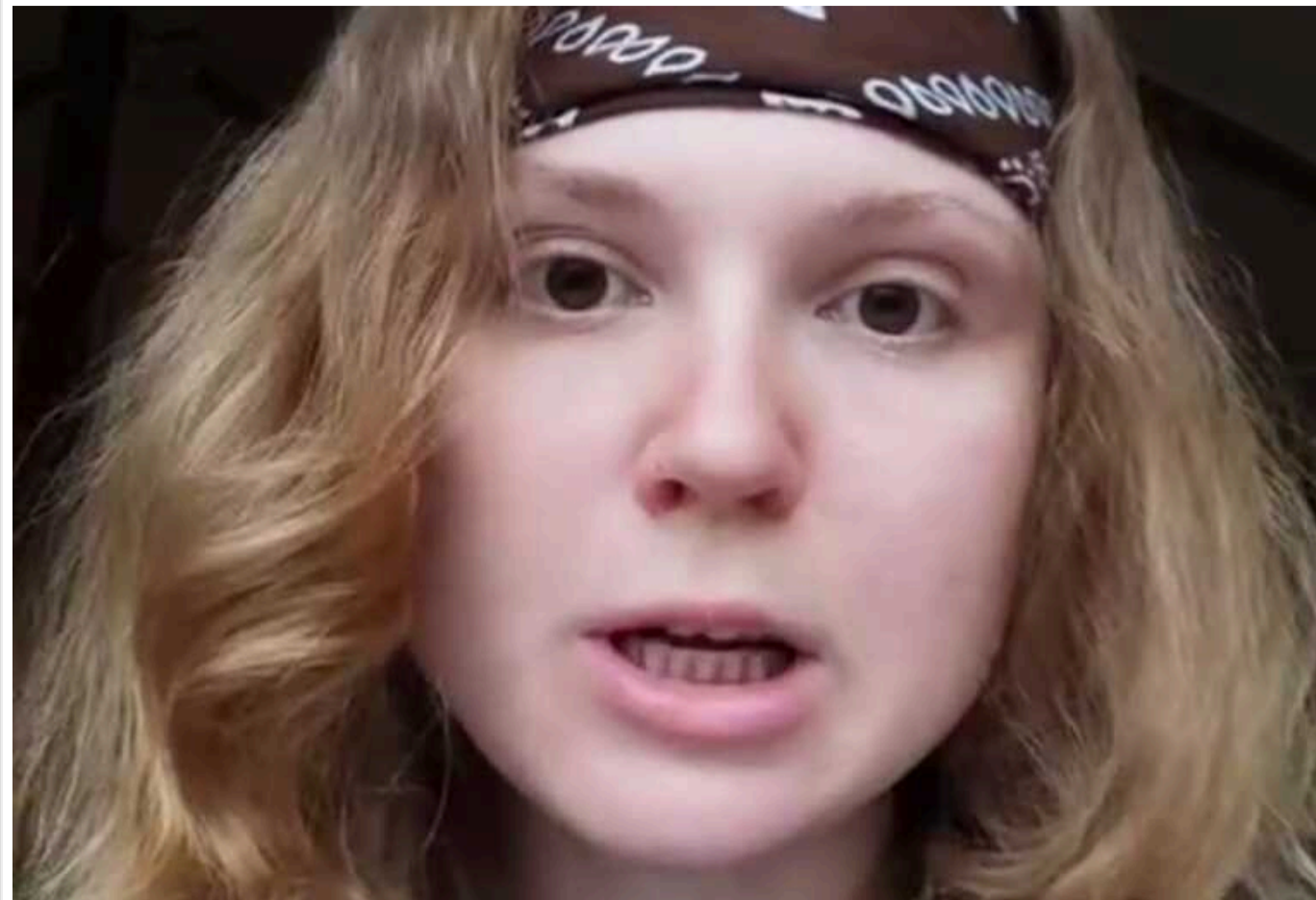
На Закарпатті військові та поліція без пояснень влаштували погром у молодіжному кемпінгу