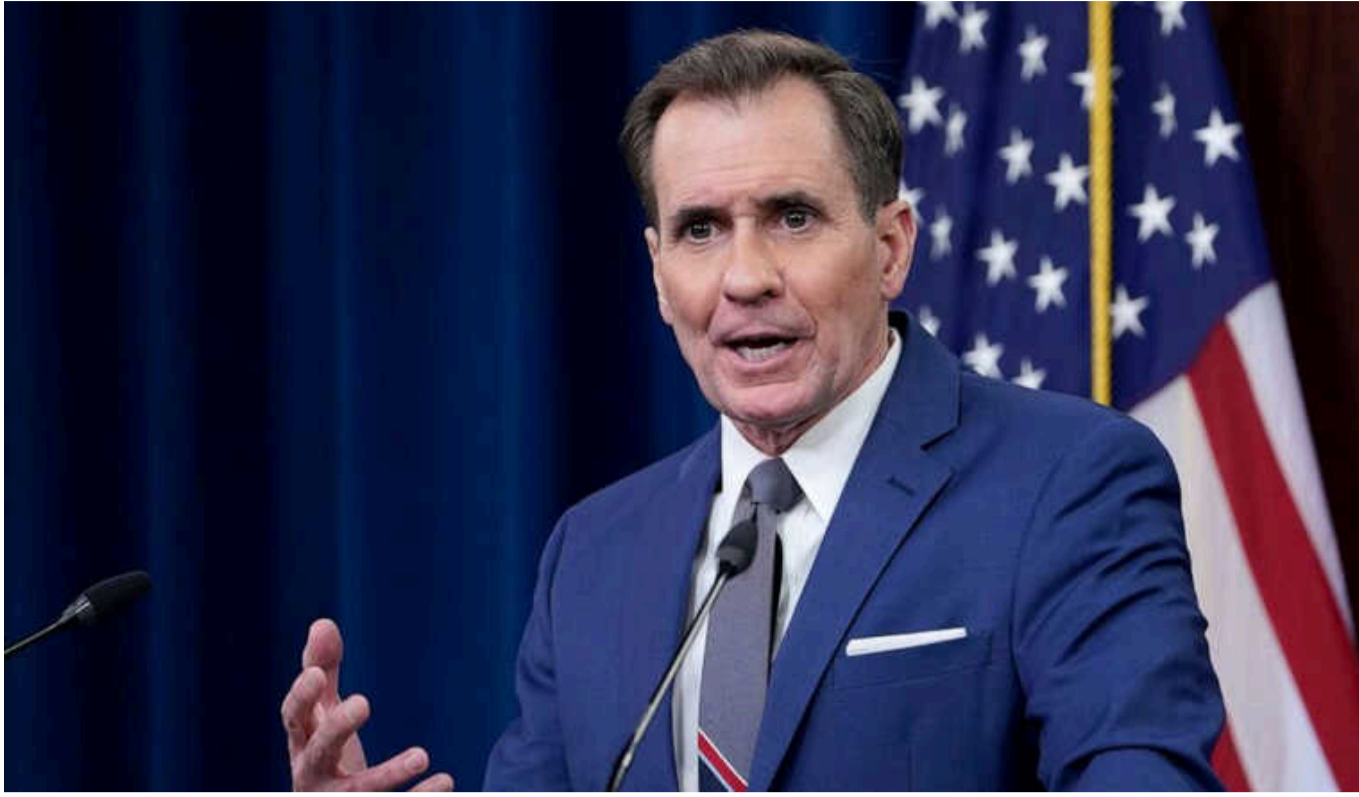
Україні для вступу в НАТО потрібно перемогти Росію у війні, – Кірбі

Україні треба перемогти у конфлікті з Росією для вступу в НАТО.