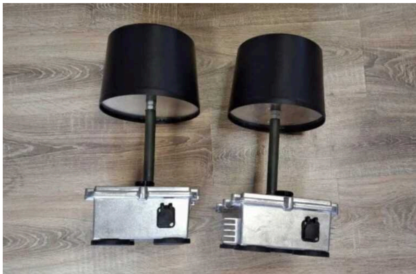
Для ЗСУ створили покращену систему РЕБ «Кульбаба 150»

Оновлена "Кульбаба 150" може ефективніше працювати в літню пору, а також стала більш стійкою до пошкоджень.