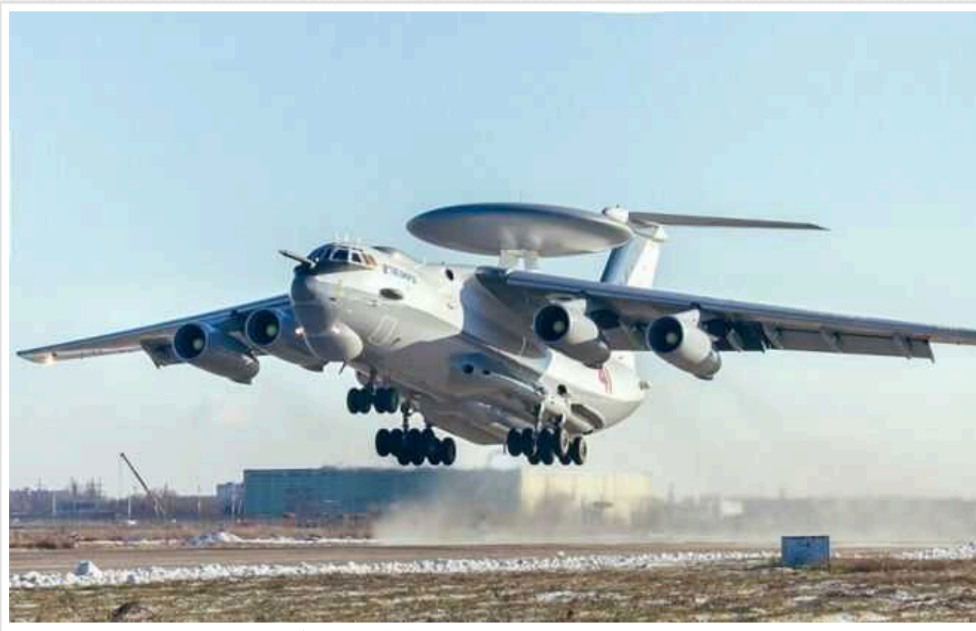
У Росії визнали, що Україна в лютому збила літак А-50

Російська Федерація фактично визнала, що у лютому 2024 року Україна збила їхній літак А-50.