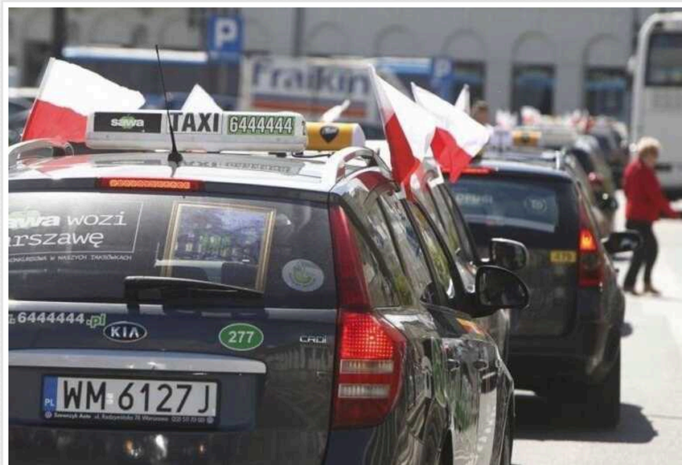
Польща заборонила українським водіям працювати у таксі без отримання польських прав

Від сьогоднішнього дня, 17 червня, водії, які здійснюють пасажирські перевезення у Польщі з використанням застосунків, таких як Uber чи Bolt, обов'язково повинні мати чинні польські водійські права.