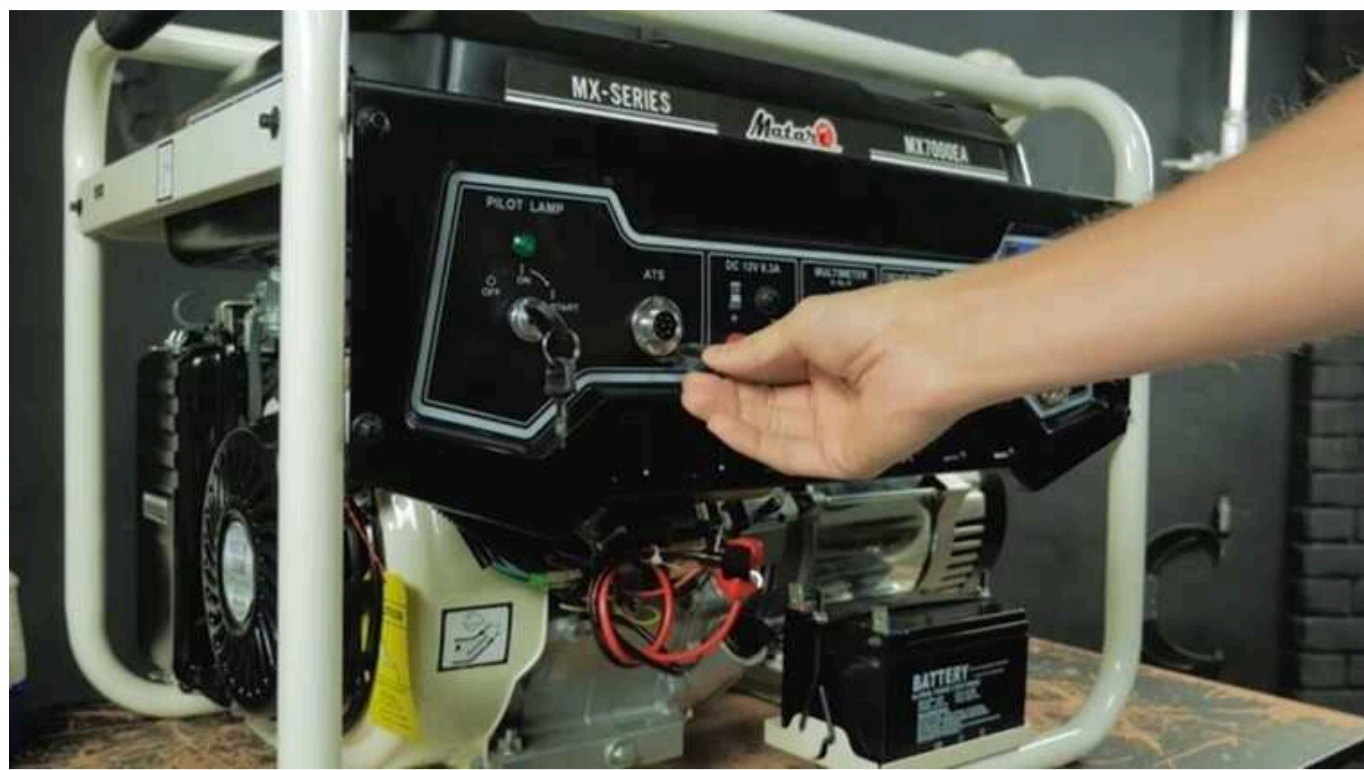
У МОЗ спростували інформацію про «штраф за генератори»

У Міністерстві охорони здоров'я заявляють, що під час ліквідації аварійних та надзвичайних ситуацій норми щодо допустимого рівня шуму, зокрема від генераторів, не застосовуються.