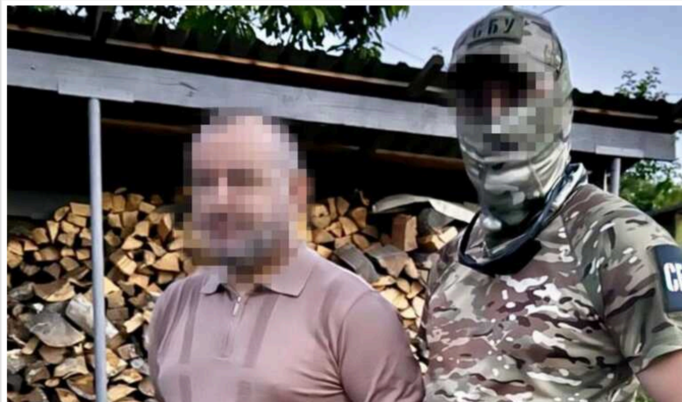
СБУ заблокувала ще три схеми ухилення від мобілізації та виїзду за кордон

Служба безпеки України заблокувала ще три схеми ухилення від мобілізації та незаконного виїзду за кордон чоловіків призовного віку. У різних регіонах України було затримано організаторів цієї незаконної діяльності.