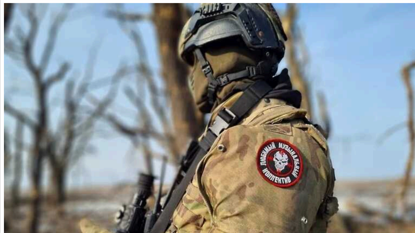
У РФ "вагнерівець" напав на дитину з ножем: його затримали

У Краснодарському краї Росії "вагнерівець" напав на дитину з ножем. Мотив чоловіка невідомий, його затримали російські правоохоронці.