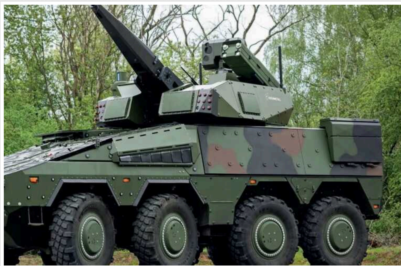
Україна отримає новітній німецький танк Frankenstein

Найближчим часом українські військові отримають від Німеччини новітній танк Frankenstein. Він здатен збивати ракети й дрони.