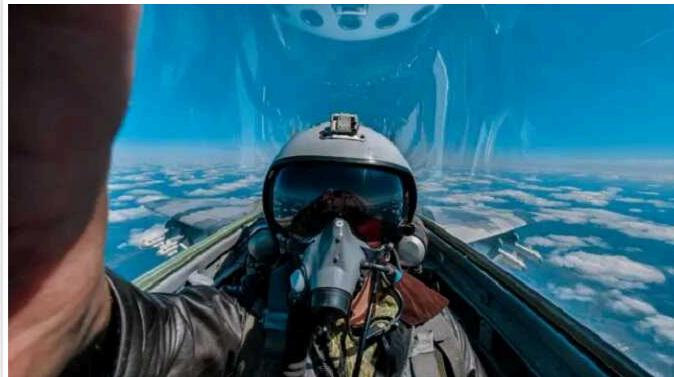
Олещук показав бойову роботу українських льотчиків по ворожих цілях

Українські льотчики активно працюють по ворожих цілях на суходолі та в повітрі, а з прибуттям у всі бригади західних літаків ця робота буде значно ефективнішою.