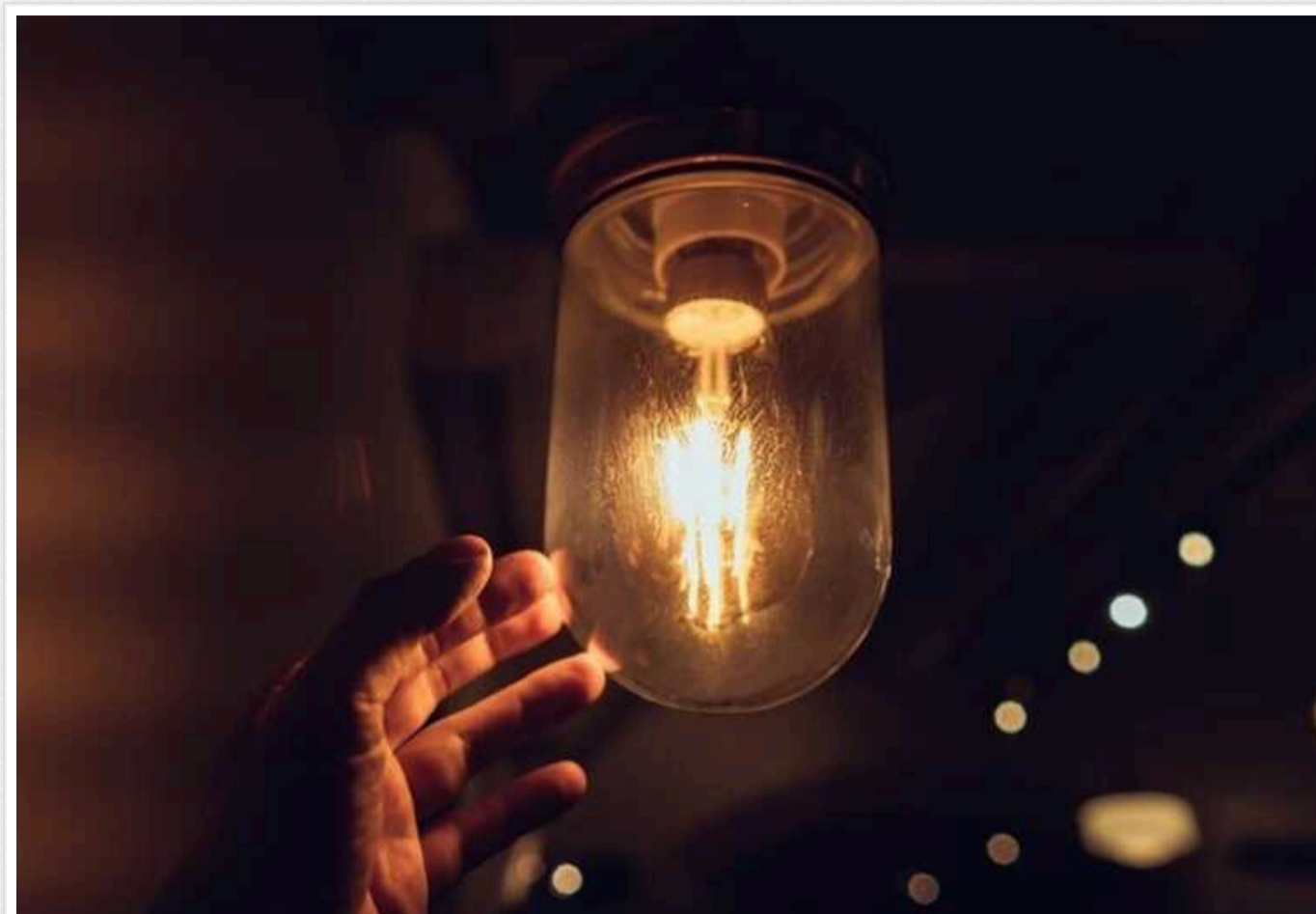
Узимку світло можуть давати по 6-7 годин на день, - гендиректор Yasno

Українцям слід підготуватися до тривалих відключень електроенергії у зимові місяці. Світла може бути більшу частину доби.