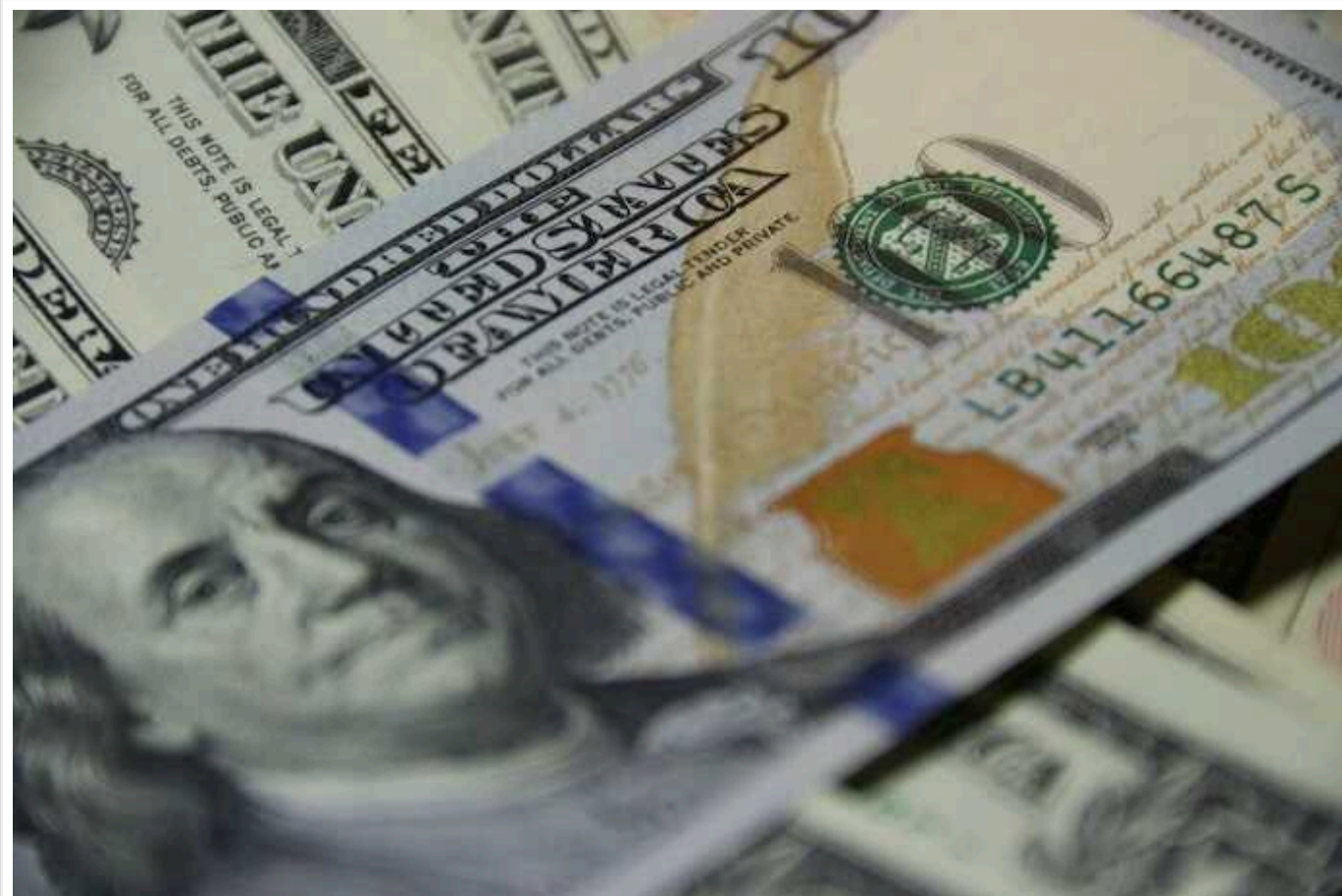
Нацбанк продав майже 900 мільйонів доларів на міжбанку

За тиждень з 10 по 14 червня Національний банк України продав на міжбанку 898 млн дол, при цьому, купив 180 тис дол.