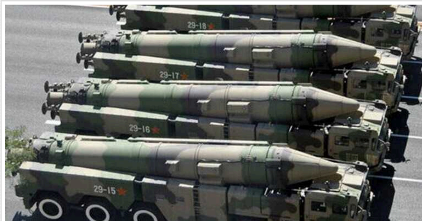
Витрати на ядерну зброю досягли 91,4 мільярдів доларів у 2023 році

Міжнародна кампанія за заборону ядерної зброї в своєму звіті опублікованому у понеділок стверджує, що дев'ять держав світу, які мають ядерну зброю, витратили минулого року 91,4 мільярда доларів, тобто вони витрачали майже 3000 доларів на секунду, "продовжуючи модернізувати, а в деяких випадках і розширювати свої арсенали" ядерної зброї.