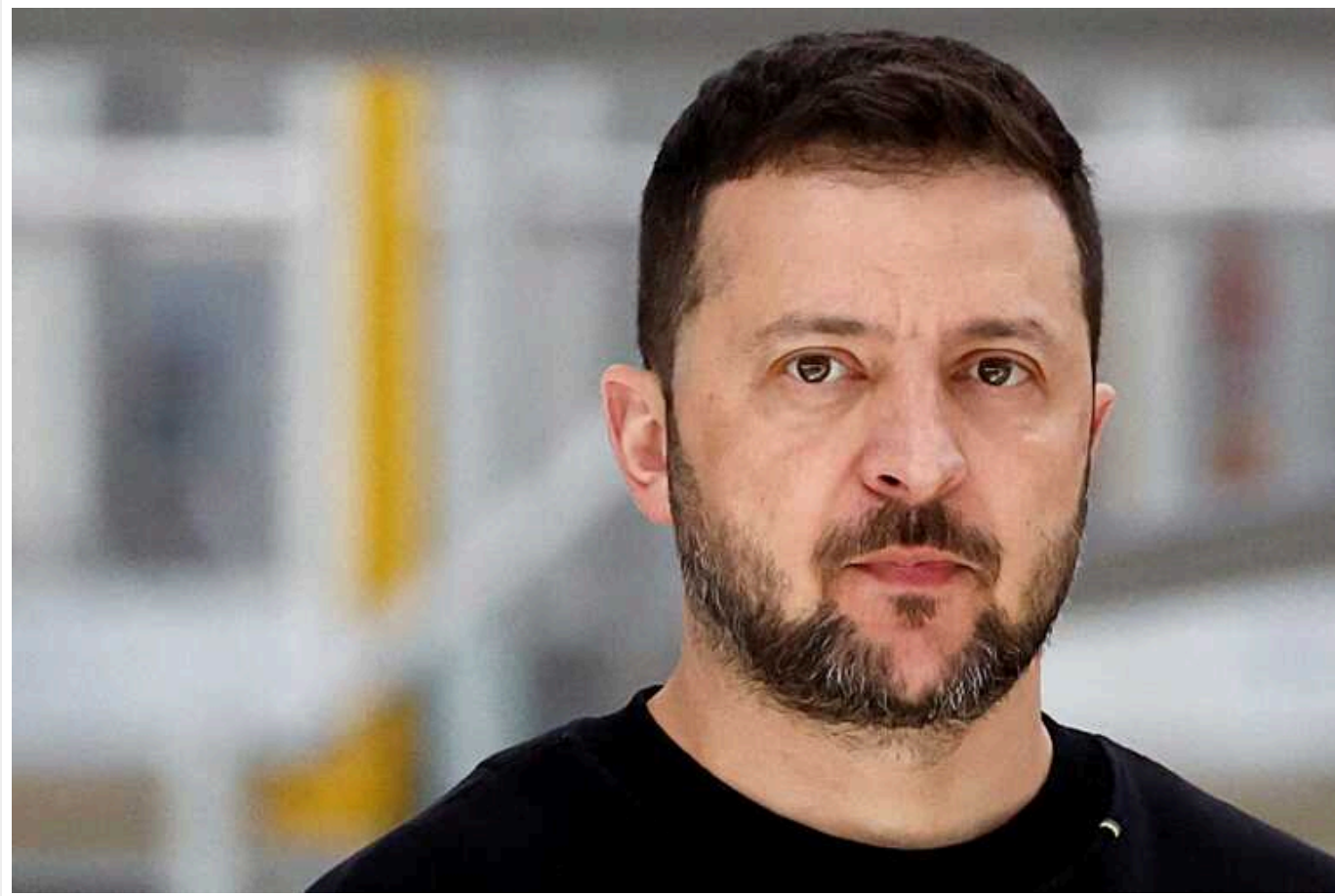
70% українців вважають, що Зеленський має залишатися на своїй посаді до кінця війни, — КМІС

Абсолютна більшість (70%) українців вважають, що президент України Володимир Зеленський має залишатися на своїй посаді до кінця дії режиму воєнного стану, свідчать результати опитування, проведеного Київським міжнародним інститутом соціології (КМІС) у межах проєкту Mobilise із 26 травня до 1 червня.