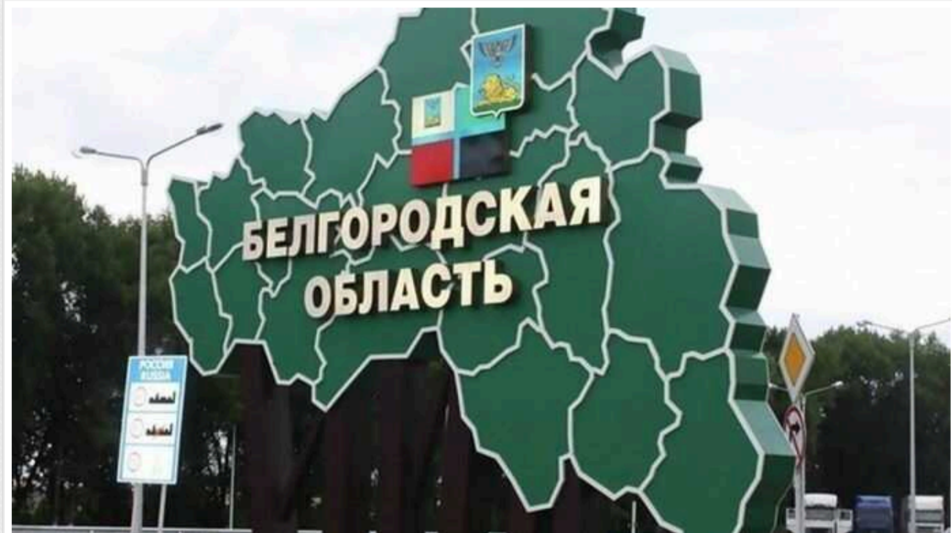
За один день російські літаки скинули п'ять авіабомб на Белгородську область

У Белгородській області лише упродовж одного дня ВКС РФ скинули ще п'ять авіабомб, але влада це приховує. Це сталося у суботу, 15 червня.