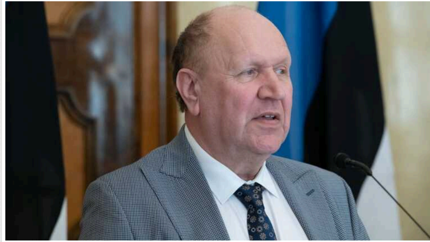
Естонський депутат закликав вислати з країни українських біженців, тому що вони розмовляють російською

ERR повідомляє, що естонський депутат Мартін Гельме, лідер Консервативної народної партії (EKRE), закликав вислати з країни українських біженців, тому що вони розмовляють російською, і вдвічі скоротити допомогу Україні.