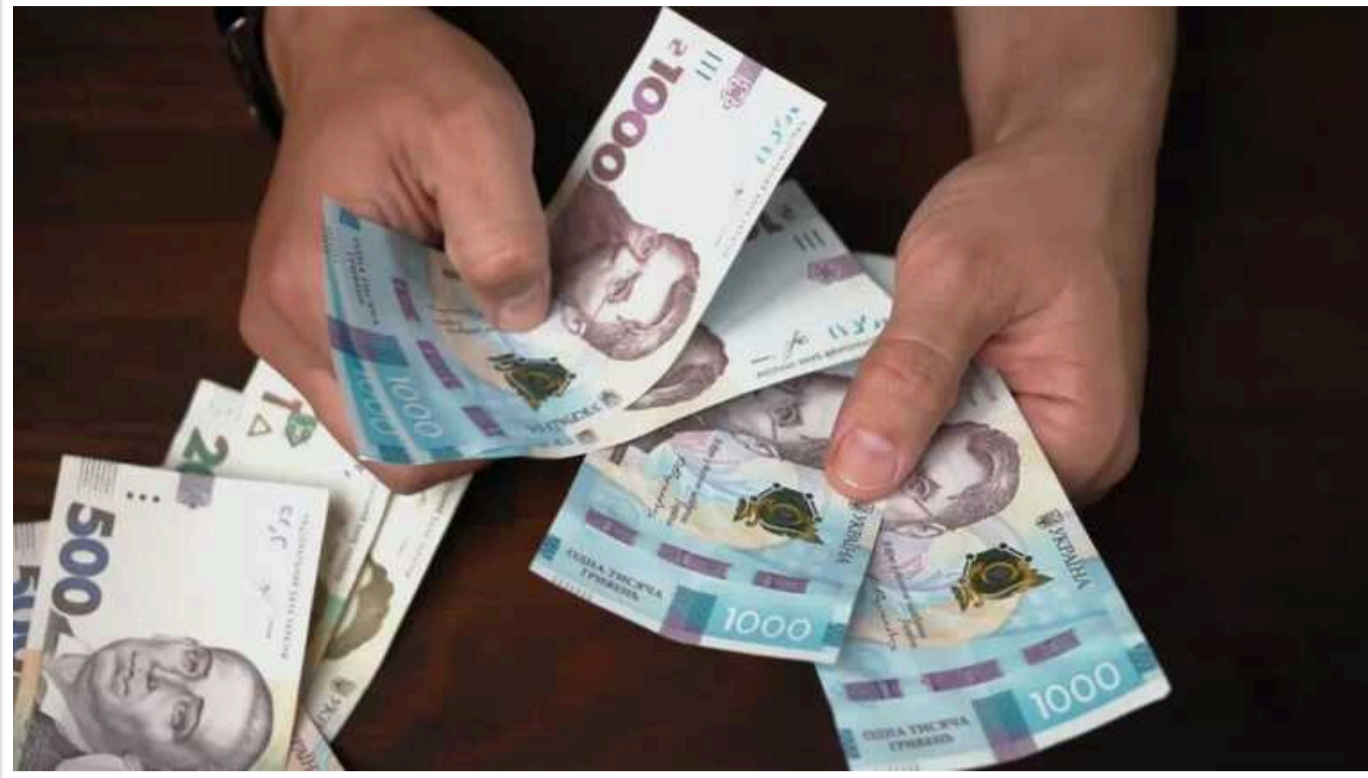
Бухгалтер військової частини організував схему, щоб забирати нарахування за «бойові»

Бухгалтер однієї з військових частин у Донецькій області організував схему щодо внесення фіктивних даних про участь солдатів у бойових діях, щоб забирати нараховані гроші за «бойові» собі та іншим учасникам схеми.