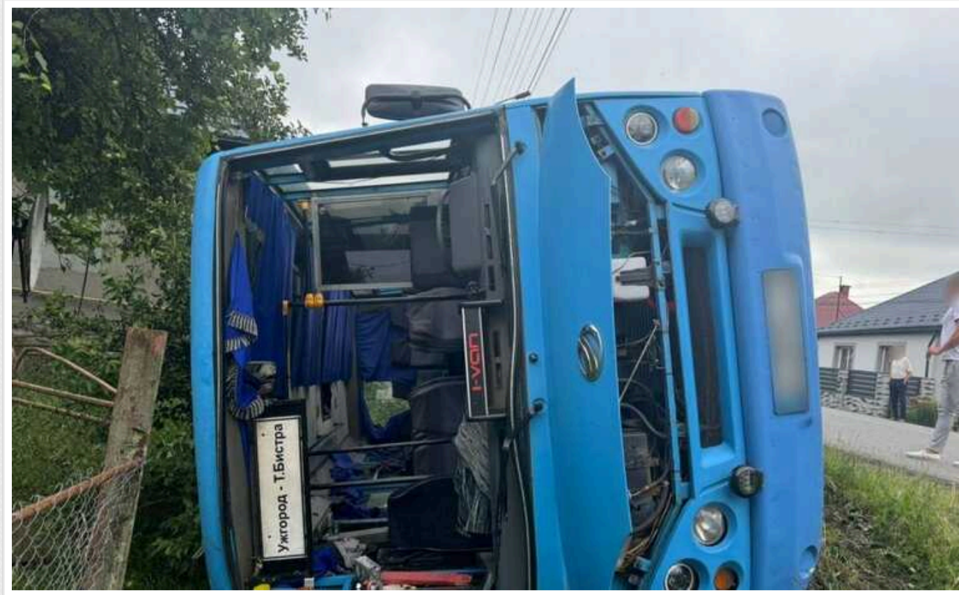
На Закарпатті рейсовий автобус перекинувся у кювет: багато постраждалих

За даними поліції, значні травми отримали троє людей – жінки 46 та 60 років, а також 17-річна дівчина.