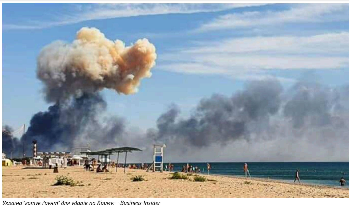
Україна "готує ґрунт" для ударів по Криму, – Business Insider

Західні експерти вважають, що, якщо Україна перемає Росію, вирішальним у цьому стане Крим , який зараз перебуває під окупацією ворога. Наразі українські сили успішно завдають ударів по російському озброєнню на півострові та атакують Кримський міст, щоб порушити логістичні шляхи окупантів.