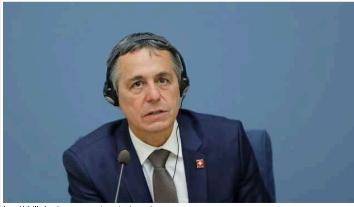
Глава МЗС Швейцарії назвав можливі терміни другого Саміту миру

Другий саміт миру може відбутися до президентських виборів у Сполучених Штатах Америки.