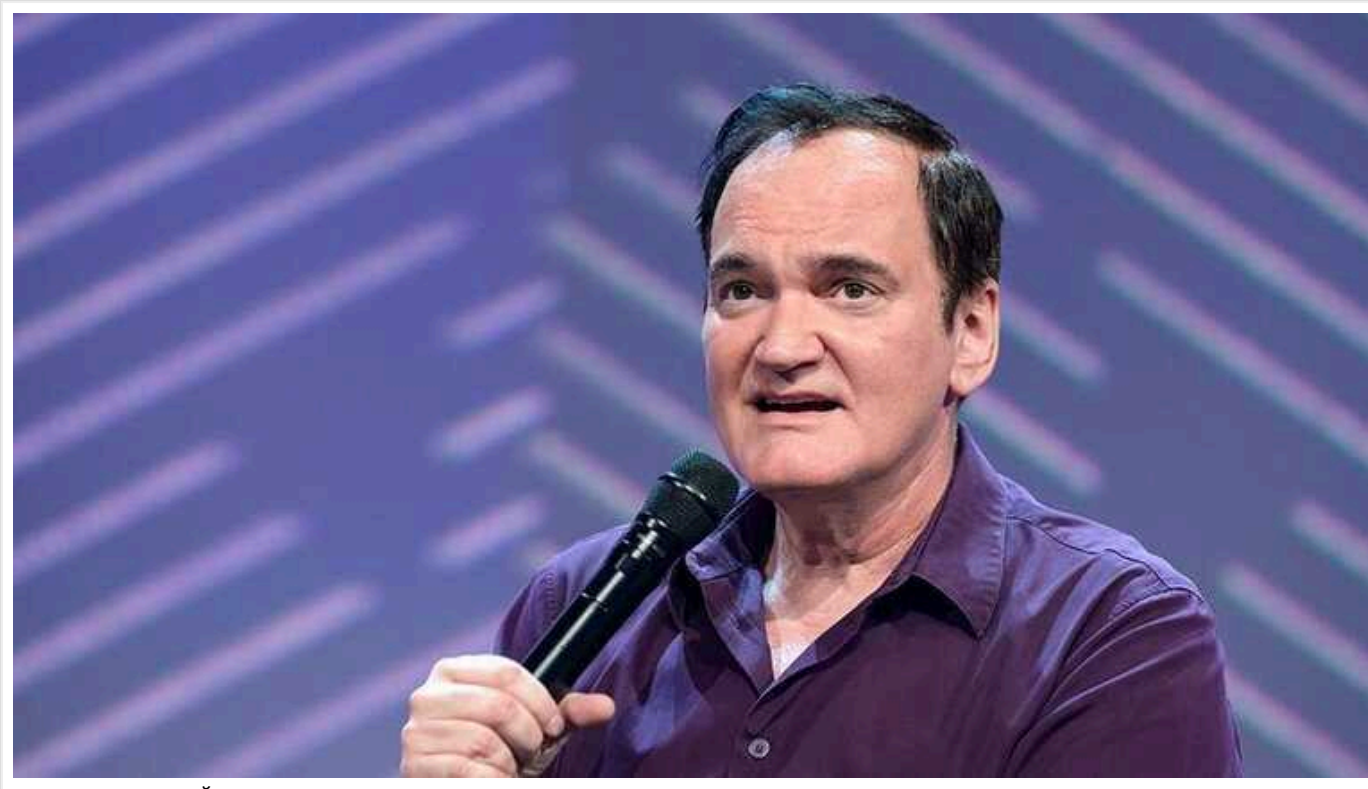
У ресторани Нью-Йорка напали на режисера Тарантіно

Антиізраїльські активісти у Сполучених Штатах напали на голлівудського режисера Квентіна Тарантіно, коли він обідав у ресторани Нью-Йорка в суботу.