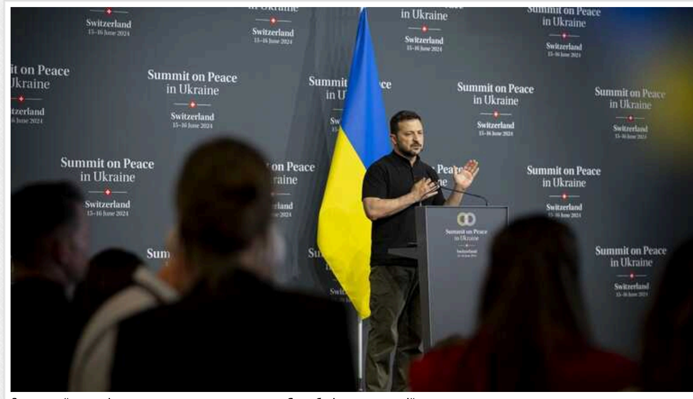
Зеленський розповів, чому провалилися переговори у Стамбулі на початку війни

Мирні переговори у Стамбулі у березні 2022 року зазнали невдачі через те, що Володимир Путін вміє розмовляти лише мовою ультиматумів. Відтоді нічого не змінилось.