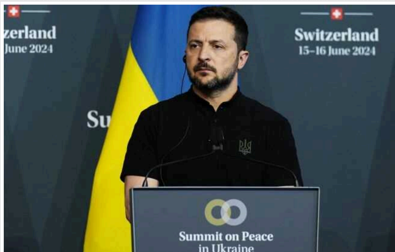
Зеленський назвав головне завдання на фронті на сьогодні

На сьогоднішній день головне завдання української армії – це зупинити наступ росіян у Харківській області.