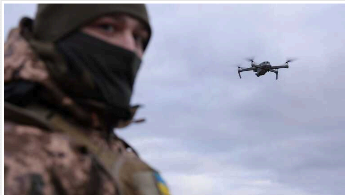
В мережі показали, як працює підрозділ Strike Drones Company: менше ста бійців знищили 2500 окупантів

Підрозділ ударних безпілотників за вісім місяців боїв на Авдіївському напрямку знищив 6 батальйонів ЗС РФ, а також сотні одиниць техніки та артилерії.