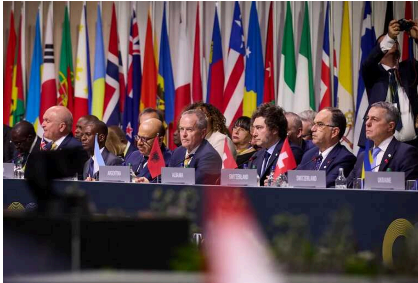
Діалог під час Саміту миру може мати абсолютно практичні кроки, - Зеленський

Президент Володимир Зеленський заявив, що Саміт миру в Швейцарії може мати "абсолютно практичні кроки" щодо звільнення Запорізької АЕС, продовольчої безпеки та визволення українських полонених з РФ. Глава держави висловив сподівання, що їх буде реалізовано настільки швидко, наскільки це можливо.