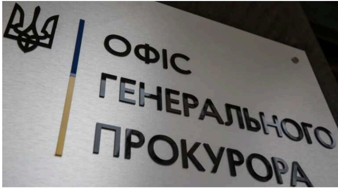
Дружина керівника департаменту Офісу генпрокурора Віталія Бровка вклала 25 мільйонів гривень у криптовалюту

Дружина начальника департаменту Офісу генпрокурора Віталія Бровка купила 18 видів криптовалюти, витративши понад 25 млн гривень.