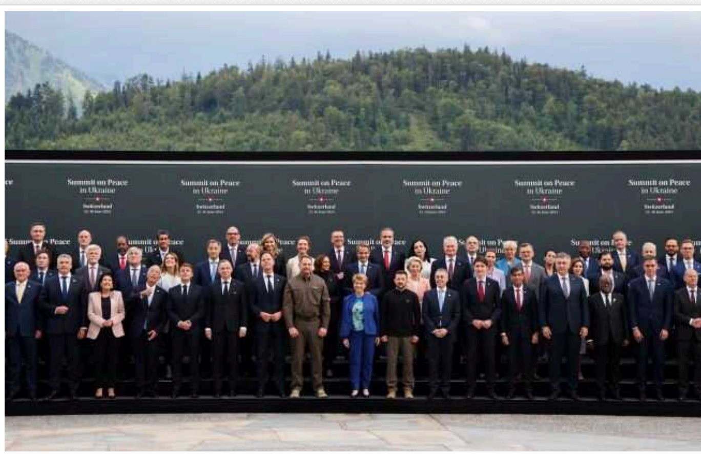
У ЗМІ розповіли, що у спільній заяві Саміту миру: безпека на ЗАЕС, доступ до портів та повернення полонених

Учасники саміту миру у Швейцарії ухвалили спільне комюніке. Воно включає три аспекти української "формули миру".