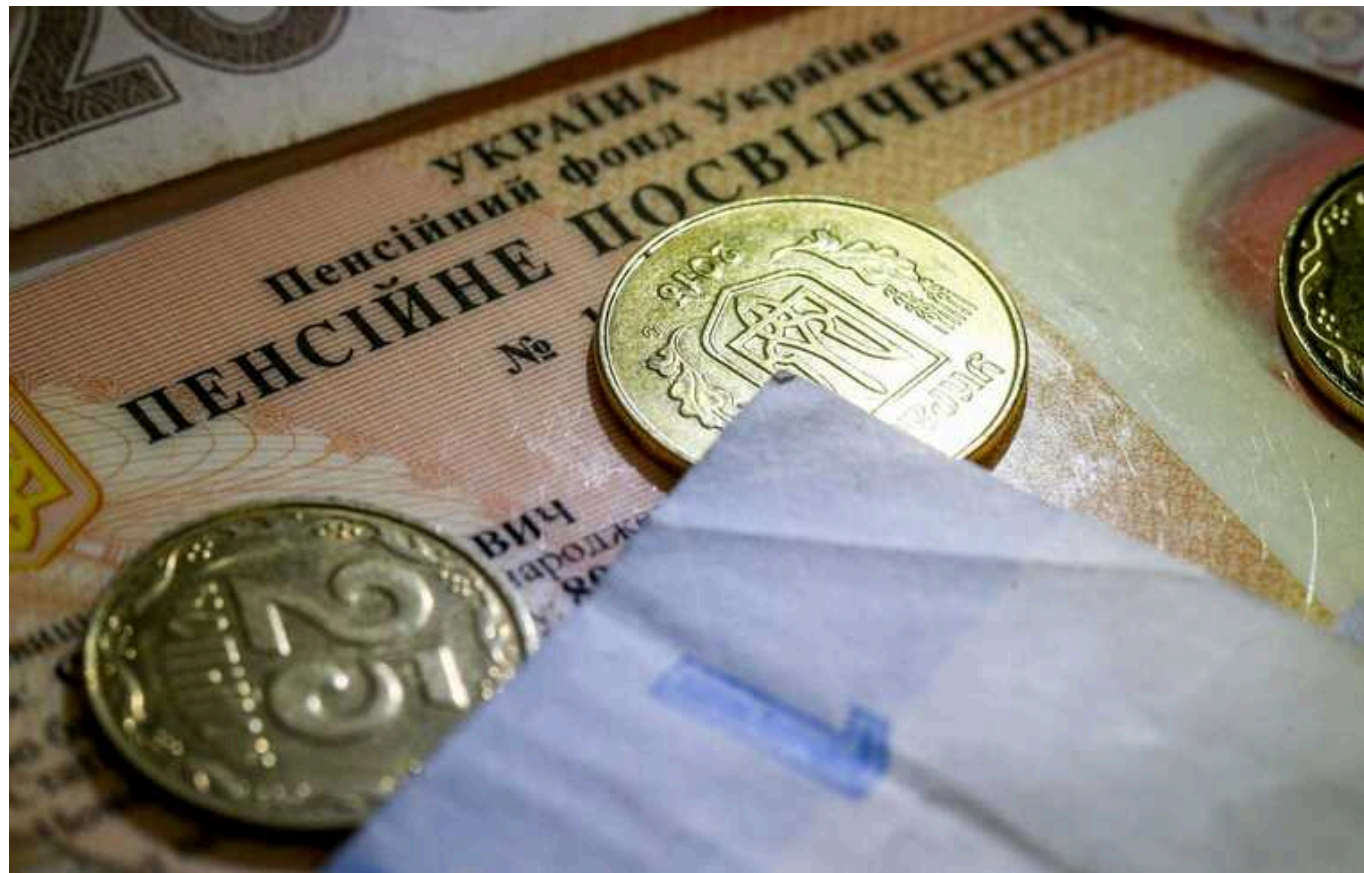
Українці можуть виходити на пенсію раніше - за гроші

Українці можуть вийти на пенсію за віком або за страховим стажем. Чим більше стажу має людина, тим раніше зможе вийти на заслужений відпочинок. Але якщо стажу не вистачає, його можна докупити на сайті Пенсійного фонду. Один рік стажу коштуватиме понад 21,1 тис. грн.