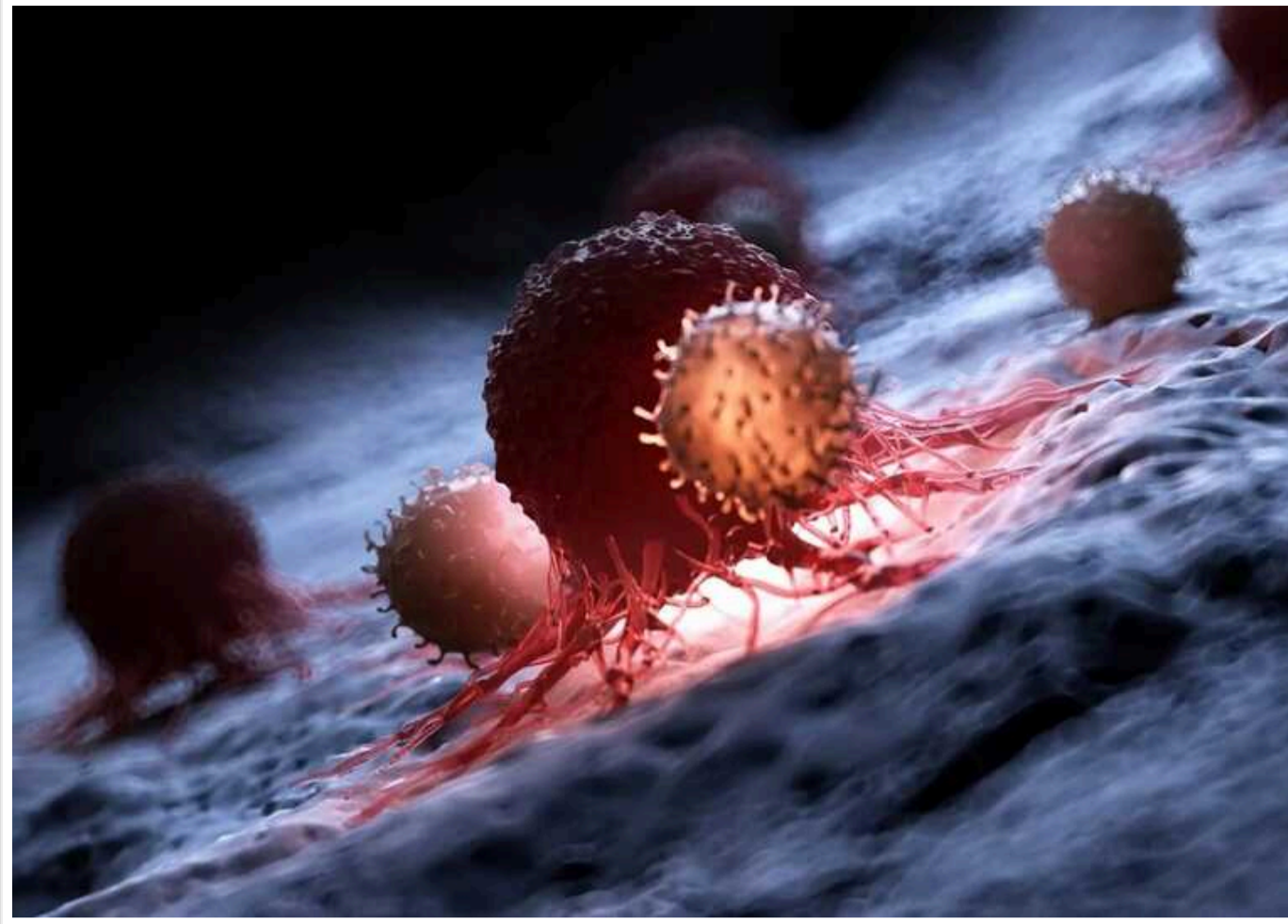
Вчені виявили ген, який може допомогти позбавити людство від раку

Nature Cell Biology повідомляє, що вчені вперше в історії виявили ген, який може допомогти позбавити людство від раку.