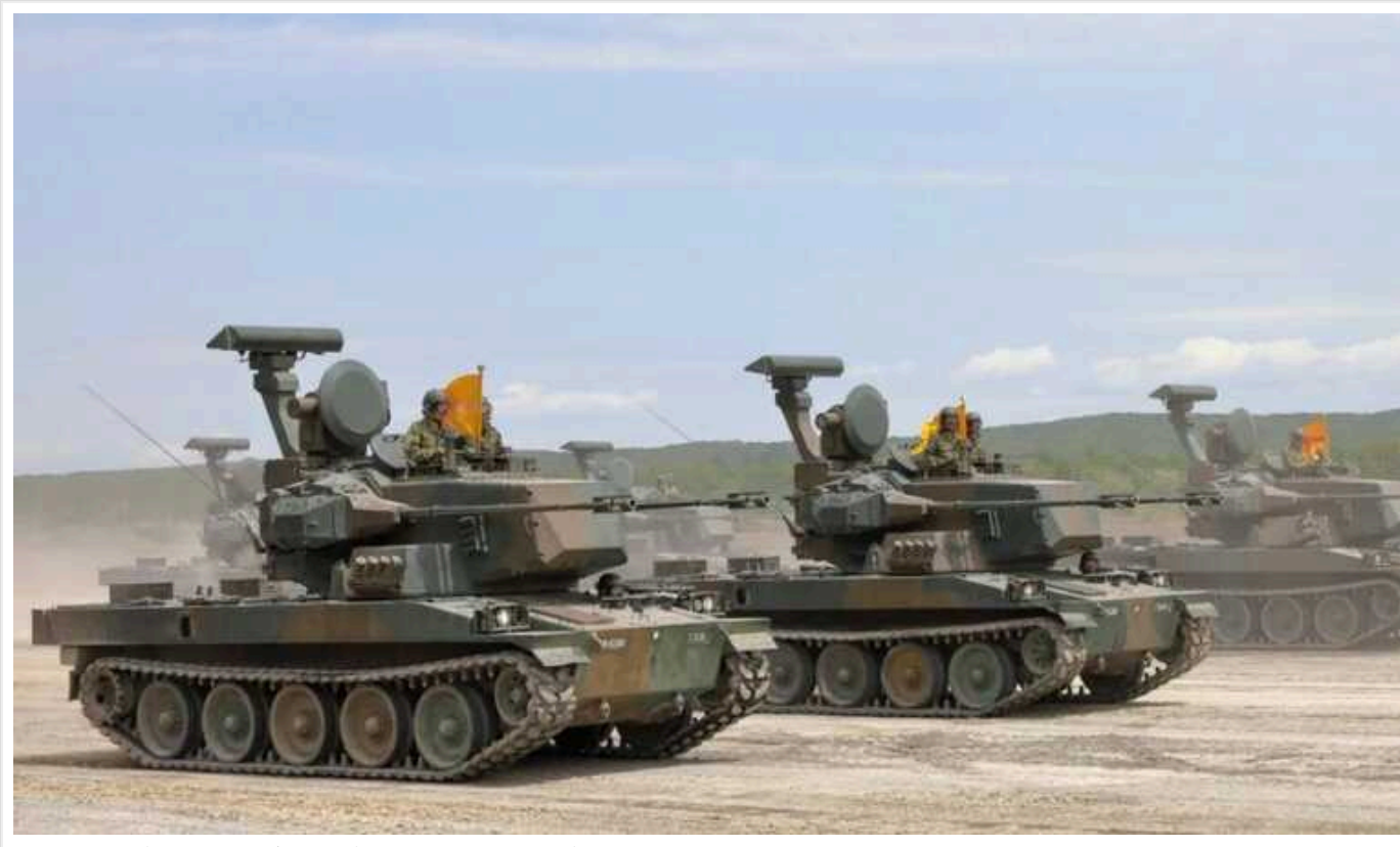
В Японії придумали, як збивати дрони та ракети зі 155-мм гармат

В Японії оприлюднили проєкт 155-мм зенітної артилерійської системи, яка зможе знищувати дрони на малих дистанціях. Передбачається, що ця система зможе збивати повітряні цілі на відстані 5-15 км.