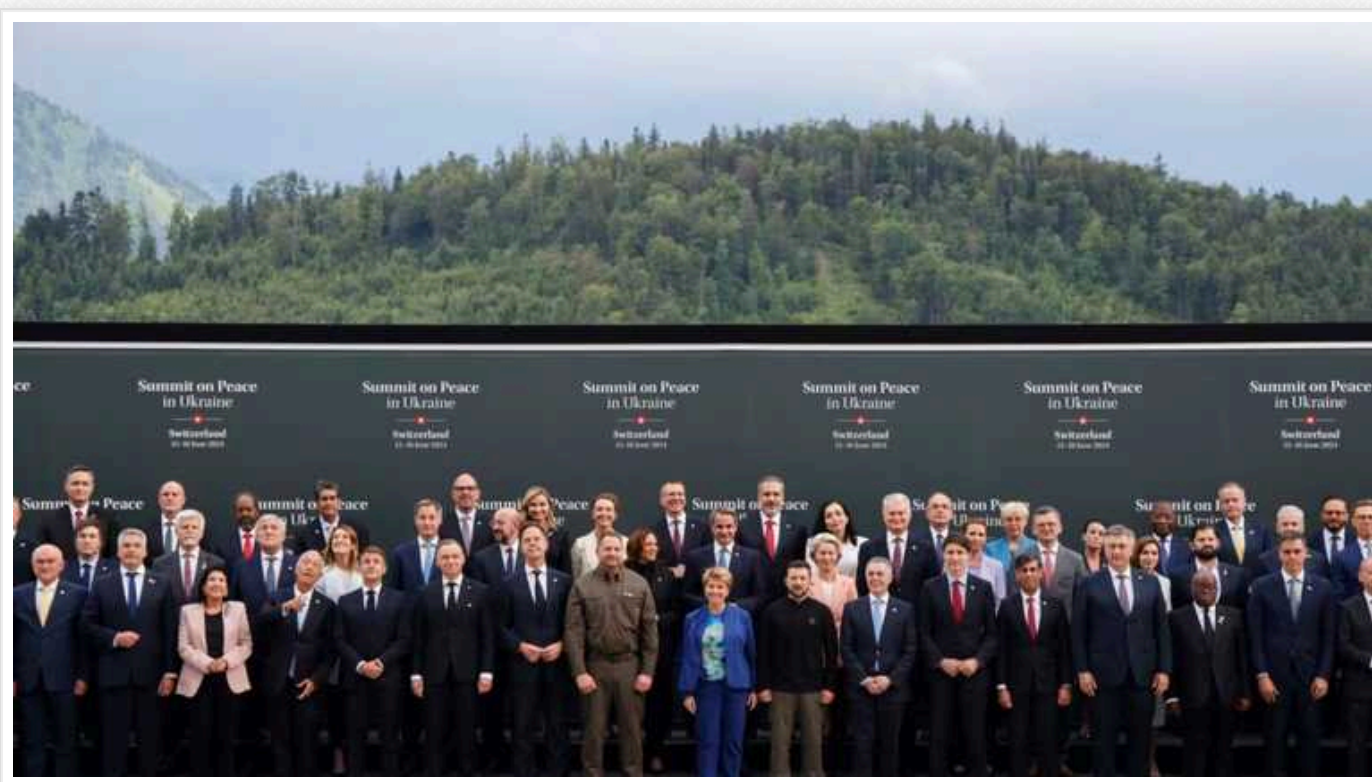
Підсумкове комюніке Саміту миру підтримали 80 країн та 4 організації

80 країн та 4 організації підтримали підсумкове комюніке Саміту миру.