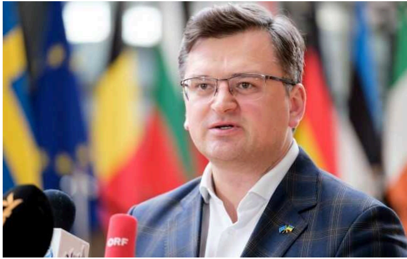
Настане момент, коли треба буде говорити з Росією, але не мовою ультиматумів, - Кулеба

Офіційний Київ усвідомлює, що рано чи пізно справа дійде до прямих переговорів із Росією. Однак ця розмова не може вестися мовою ультиматумів.