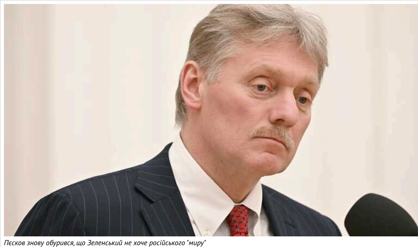
Песков знову обурився, що Зеленський не хоче російського "миру"

Спікер Кремля Дмитро Песков звинуватив президента України Володимира Зеленського в тому, що він відмовляється укладати мирні домовленості з російським диктатором Володимиром Путіним. Він заявив, що український лідер "заради Батьківщини" нібито має піти на мир із Москвою, і пригрозив Києву подальшим погіршенням ситуації на фронті.