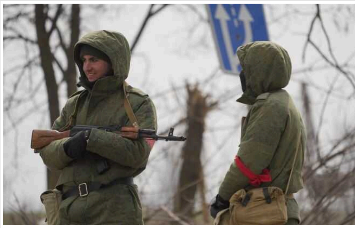
В окупованій Запорізькій області розпочався новий виток віджаття житла українців

На тимчасово окупованій частині Запорізької області "нова влада" активізувала так звану націоналізацію житла. А для того, щоб процес віджаття йшов як по маслу, послила для місцевих жителів процедуру реєстрації нерухомості й створила нову структуру. Сьогодні довести, що квартира твоя, практично нереально.